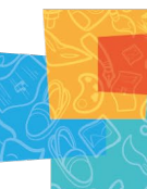
Ilustración 2. Estructura Organizacional