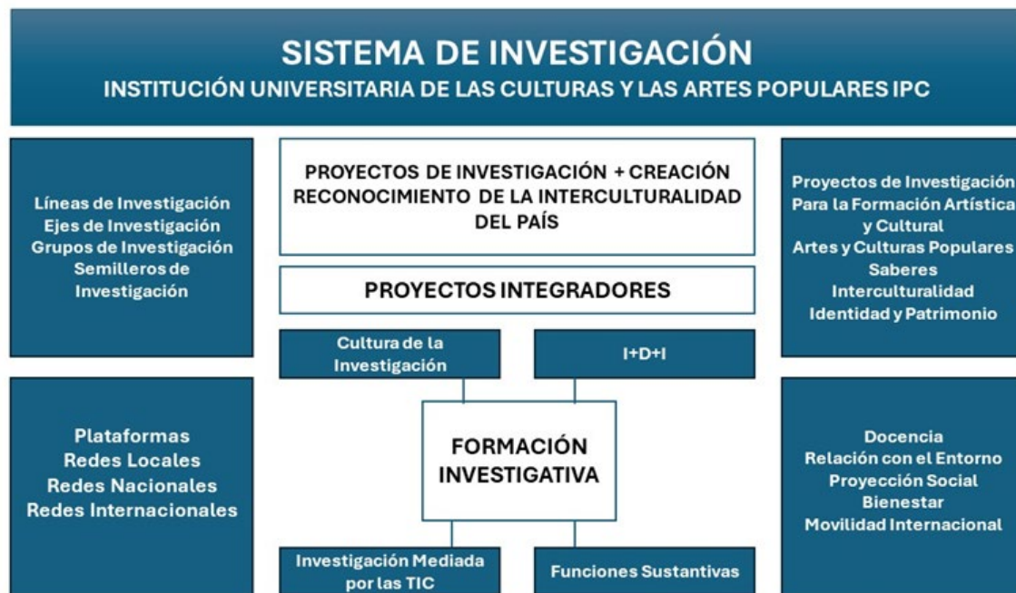
Ilustración 1. Sistema de Investigación

Nota: Elaboración propia Institución Universitaria de las Culturas y las Artes Populares IPC (2024).