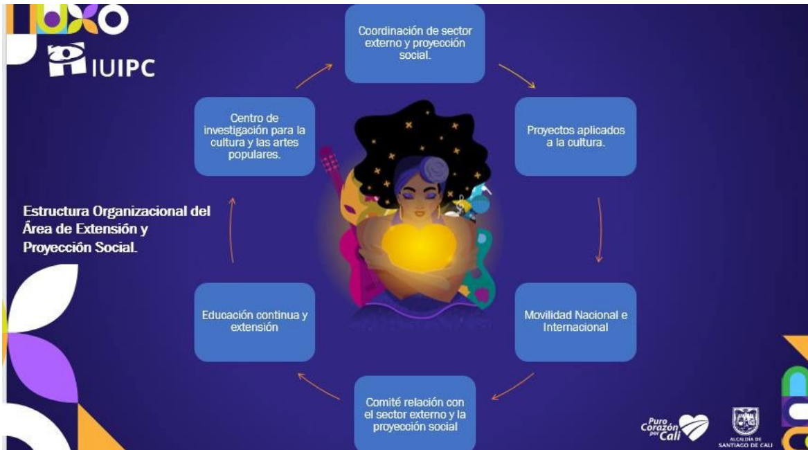
Ilustración 1 Estructura Sector Externo